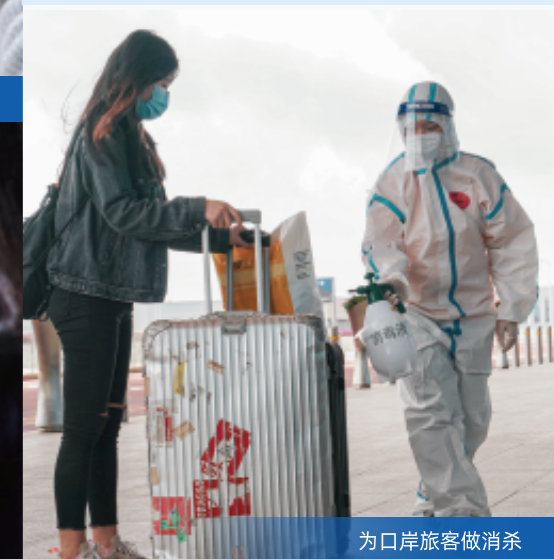
为口岸旅客做消杀