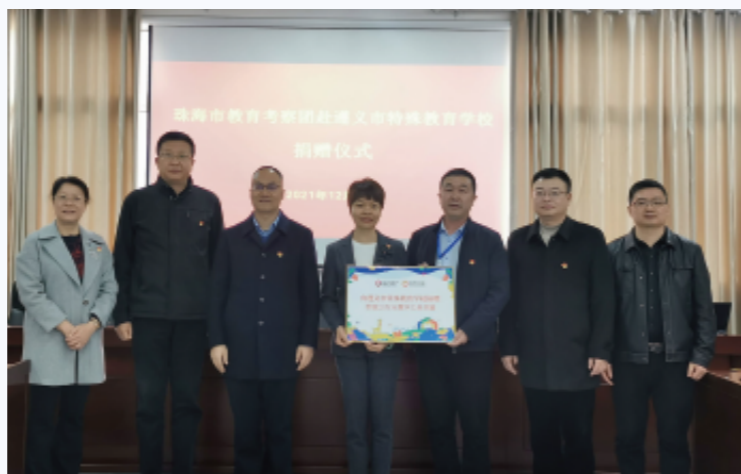
向遵义市特殊教育学校捐赠一批价值20万元的教学用品及书籍