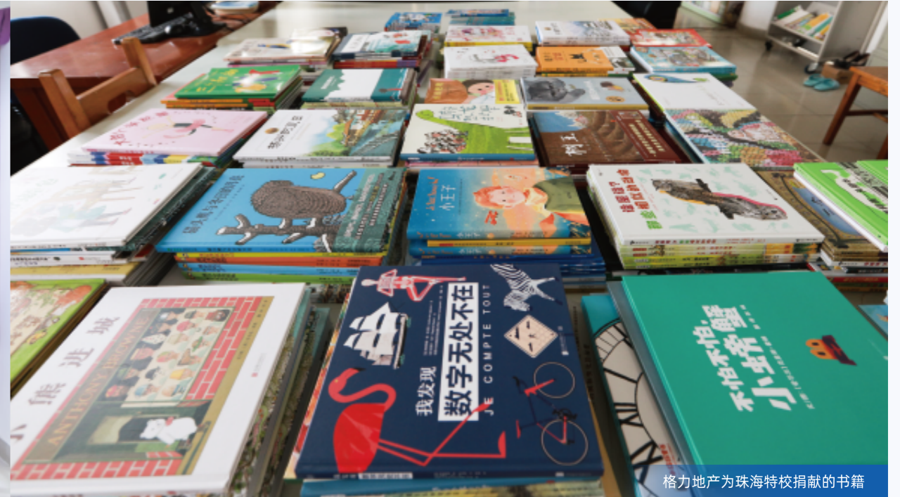
格力地产为珠海特校捐献的书籍