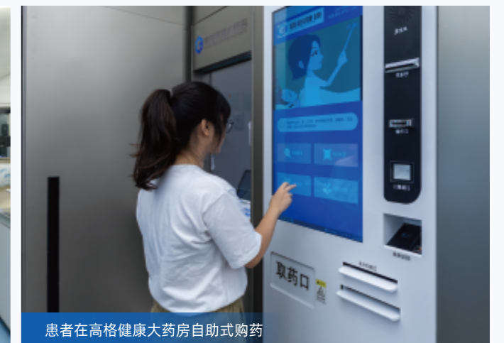
患者在高格健康大药房自助式购药