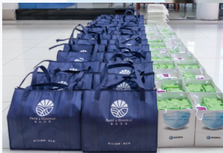
困难学生慰问物资

2021年，由格力地产董事长鲁君弼个人出资，通过海控公益基金会及旗下鲁君弼专项基金，向珠海特校26户低保困难学生家庭捐资捐物20万元，以实际行动关爱困难学生的生活状况。同时，为将特教公益的善行辐射到更多地方，2021年12月，格力地产及海控公益基金会向遵义市特殊教育学校捐赠了价值20万元的教学用具和书籍，希望在珠海特殊教育公益事业上取得的经验和成果推及更多地域的特殊儿童群体，并带动、汇聚越来越多的社会力量投入到这项特殊公益中来。