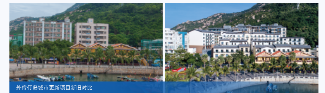
外伶仃岛城市更新项目新旧对比

自项目启动以来，格力地产坚持“生态第一”理念，在最大限度保留原建筑形式和风格的基础上，合理规划住宅区设计，最终建成高低错落、井然有序的海岛新居。2021年4月，格力地产物业公司派出物业团队入驻外伶仃岛，实施专业化、标准化的物业管理服务，不仅优化了海岛居住环境，也提升了海岛旅游资源的利用，为村民带来了新的经济增长机遇。