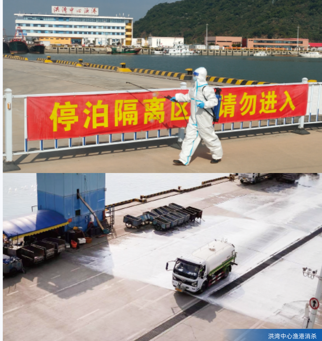
洪湾中心渔港消杀

2021年，面对新冠疫情的反复，格力地产始终严阵以待，迅速响应珠海市部署安排，各业务板块有序开展疫情防控工作，并组织以党员和员工志愿者组成的“红马甲”助力全市疫情防控工作。