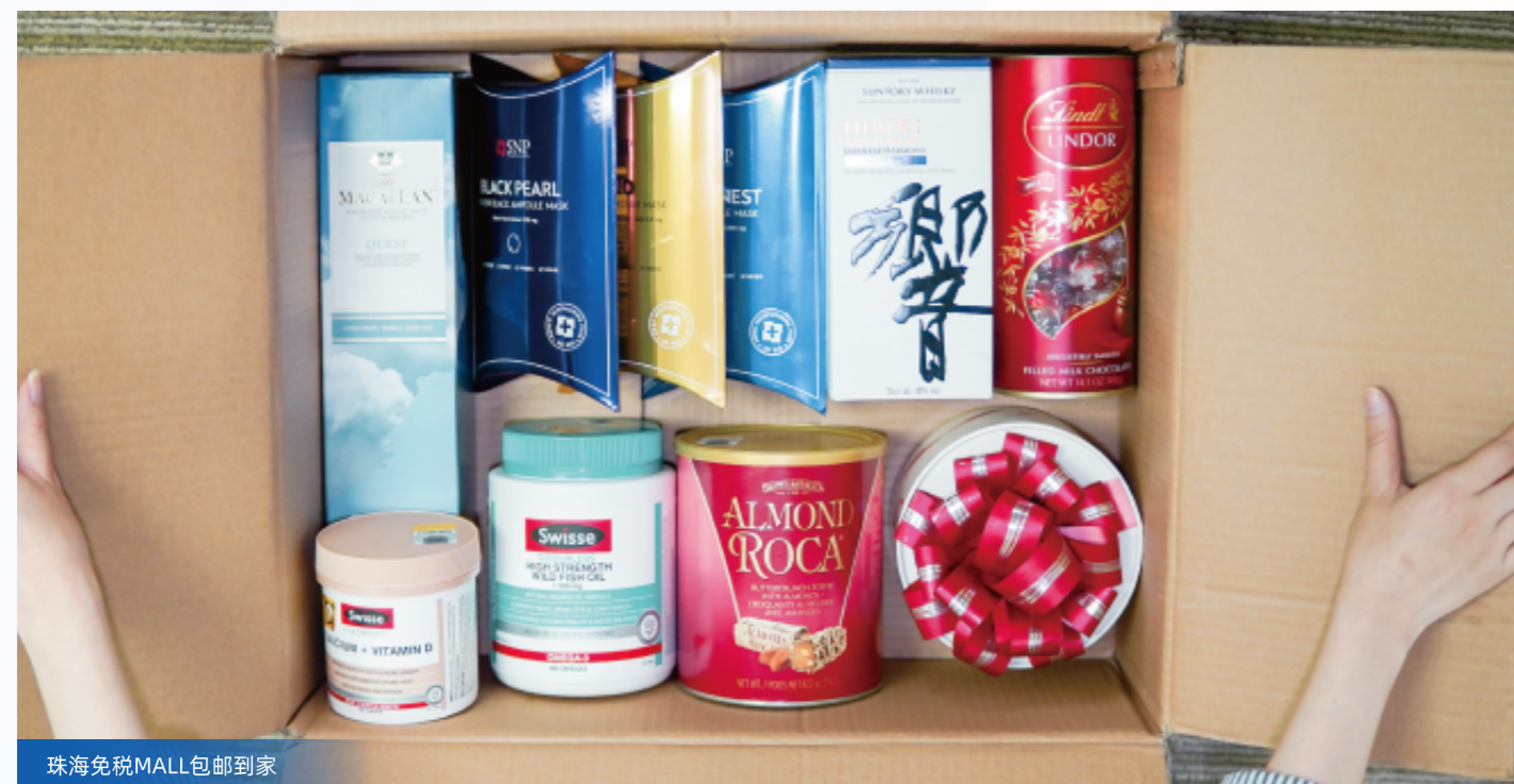
珠海免税MALL包邮到家

据统计，2021年，珠海免税MALL跨境电商SKU总量增加了 397个 ，品牌数量增加了 61个 ，新增会员总数达 8万人 ，积分总数达到 6400万