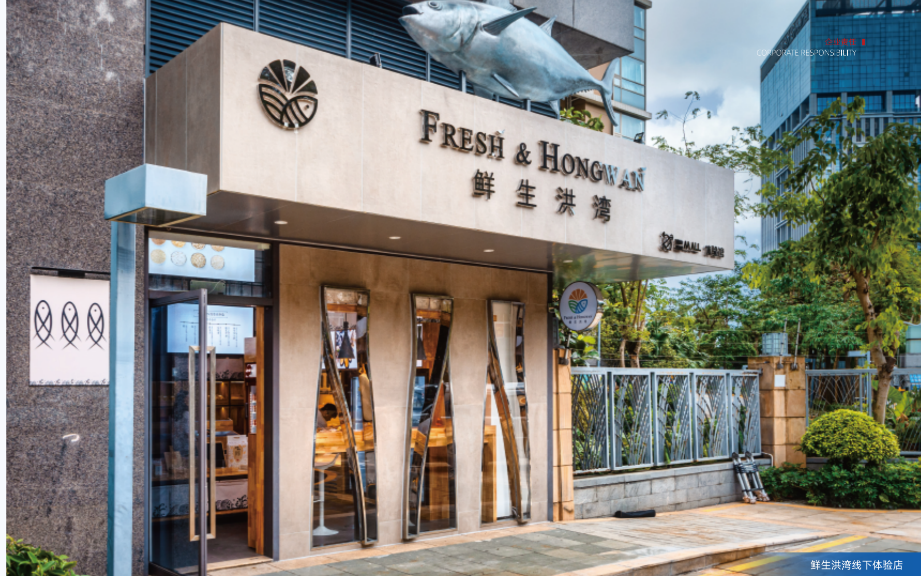
鲜生洪湾线下体验店