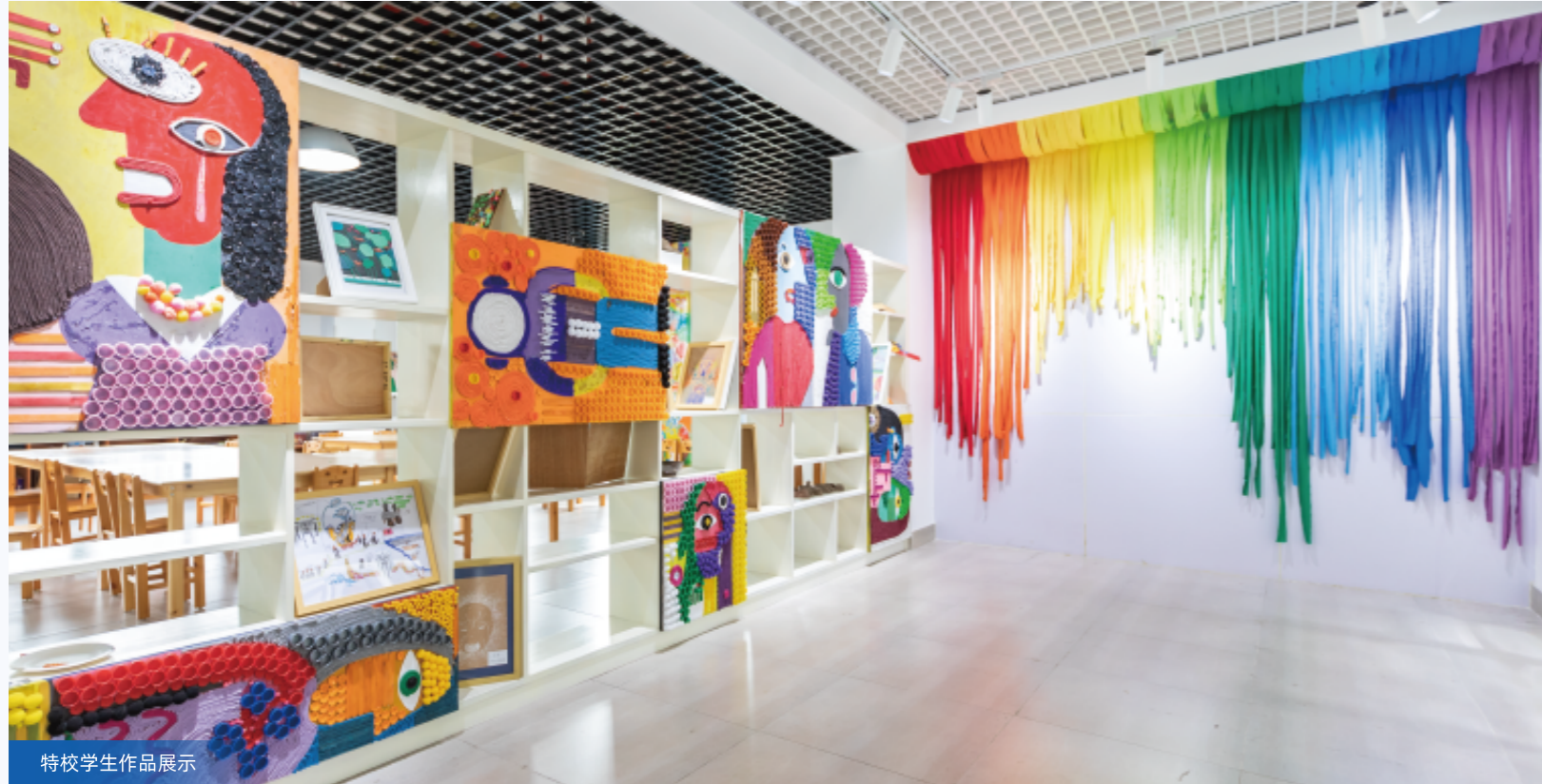
特校学生作品展示