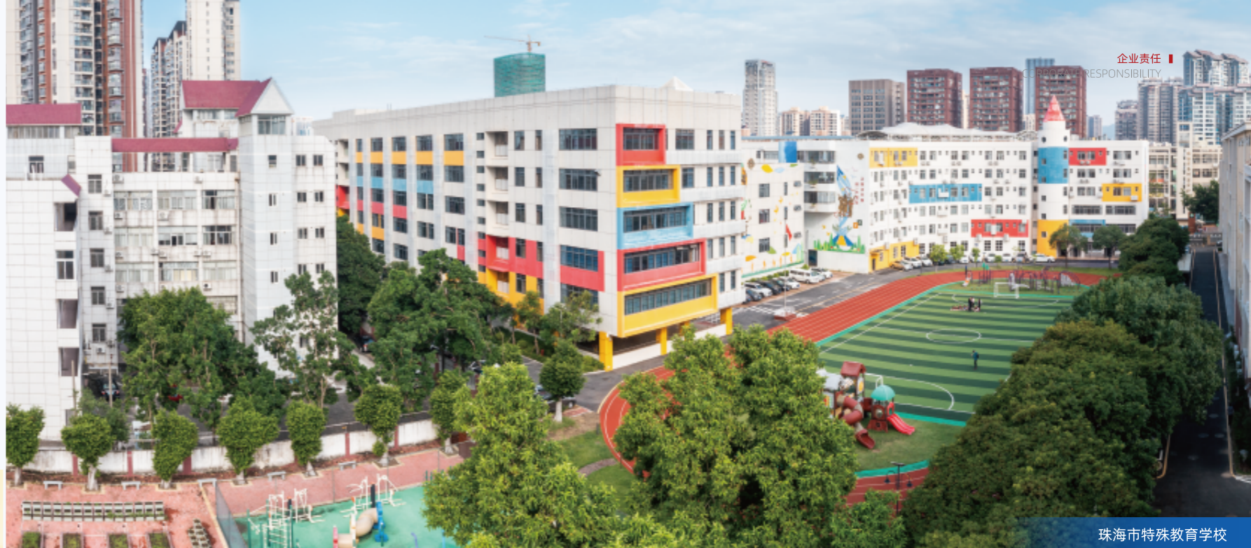
珠海市特殊教育学校

特殊教育是社会的民生工程。自2010年起，格力地产与珠海市特殊教育学校（下简称“珠海特校”）结缘，至今已携手走过12年。从帮助完善教学设备到帮扶师生成长，从企业独立善行到搭建爱心平台，格力地产一直在探索最有效的特教公益模式。