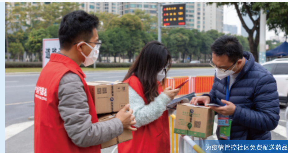
为疫情管控社区免费配送药品